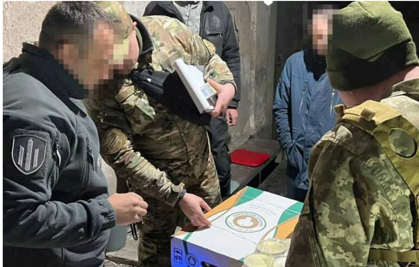
На Донеччині група осіб привласнила понад 3 тонни продовольчих товарів для військових

На Донеччині судитимуть групу осіб, яких ДБР викрило на привласненні понад 3 тонн продовольчих товарів для військових.