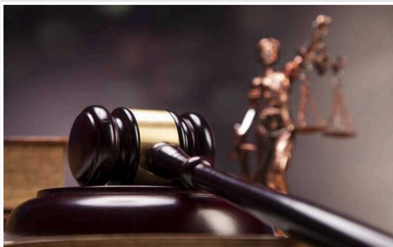
В судах Одеської області налагодили процес "віджимання" бізнесу на користь росіян

З 2015 року біля причалів Іллічівського судноремонтного заводу ржавіє судно Excalibur. У березні 2015 року, без відома власника громадянина Ізраїлю та без погодження з ним, судно зайшло в доки Іллічівського судноремонтного заводу для ремонту. Компанія SS Nordic Group K/S, від якої судно встало на ремонт не мала жодного відношення до нього та й ще на 2015 рік два роки як була ліквідована.