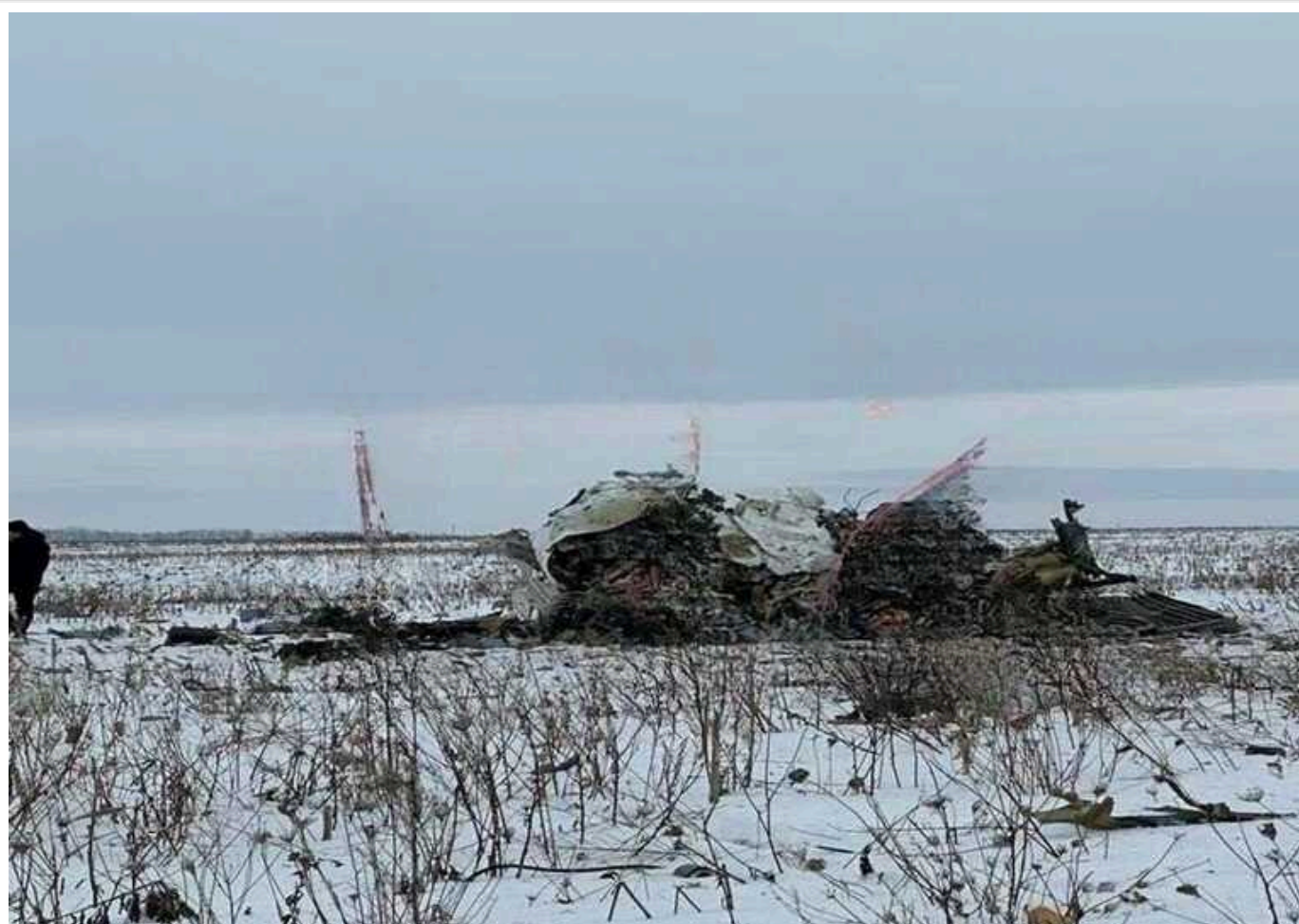
Падіння Іл-76: у Росії заявили, що готові передати Україні тіла «загиблих полонених ЗСУ»

Росія готова передати українській стороні тіла військовополонених, які загинули під час падіння Іл-76 у Белгородській області 24 січня.