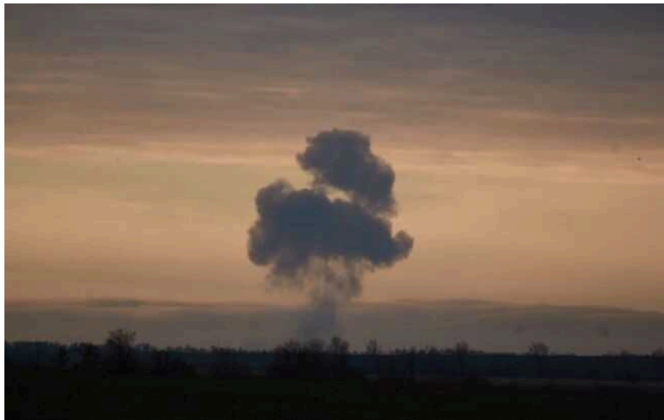
У російському Дзержинську вночі прогрімилі вибухи: там розташований завод, на якому виробляють вибухівку

Жителі російського міста Дзержинськ Нижегородської області повідомили про вибухи у ніч на 1 березня. Згодом у Міноборони РФ заявили, що область була атакована трьома БПЛА.