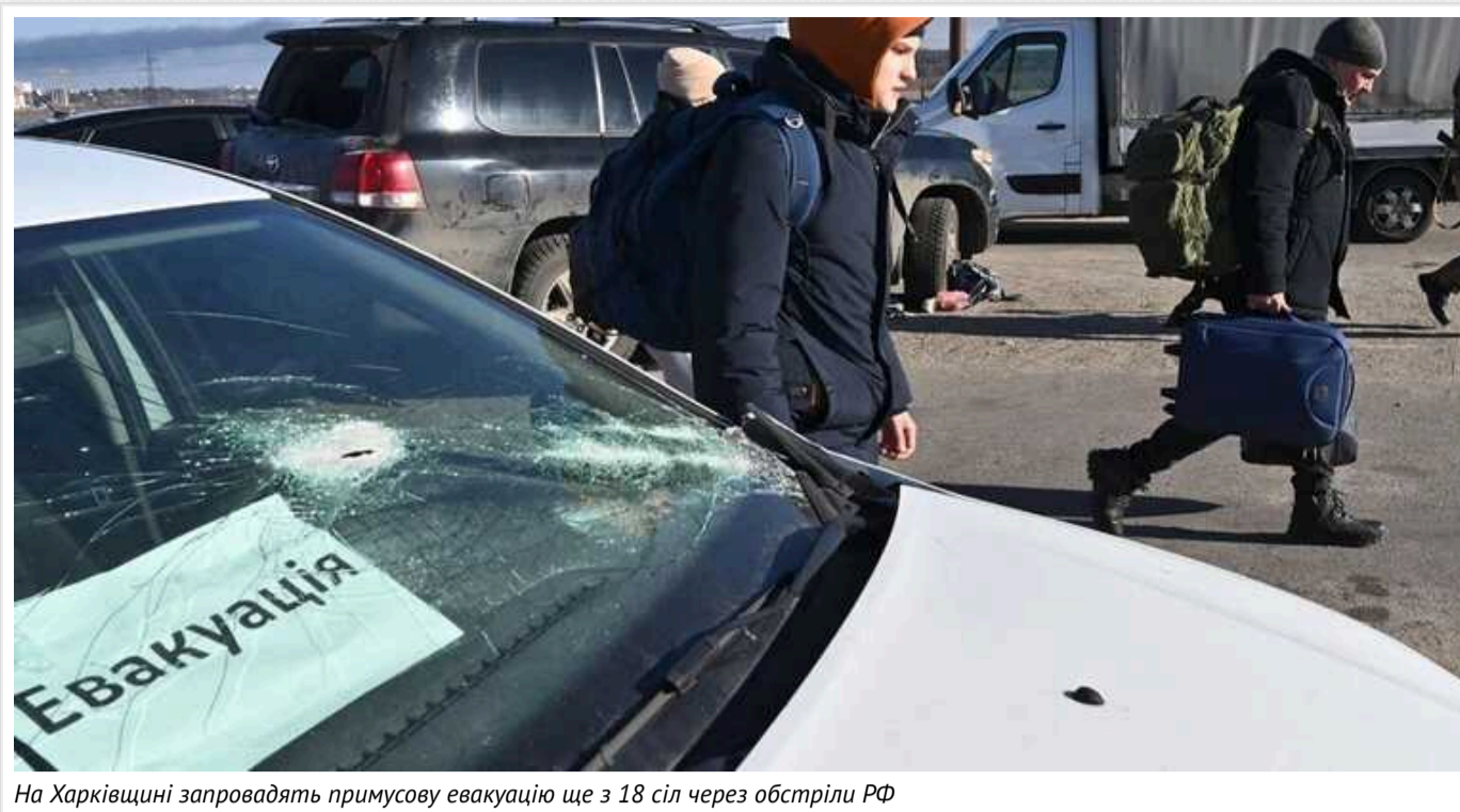
На Харківщині запровадять примусову евакуацію ще з 18 сіл через обстріли РФ

У Харківській області планують вже найближчим часом запровадити примусову евакуацію родин з дітьми ще з 18 сіл. Йдеться про населені пункти Великобурлуцької та Вільхуватської громад Куп'янського району.