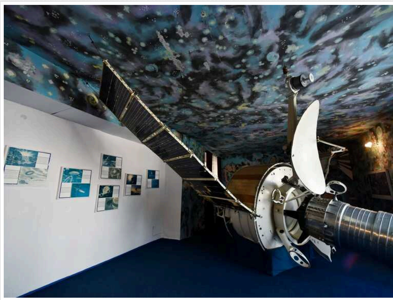
У 2025 році Польща хоче запустити свої військові супутники

Заступник міністра оборони Польщі Цезарій Томчик 29 лютого анонсував плани польського військового командування у 2025 році вивести на орбіту перші польські військові супутники.