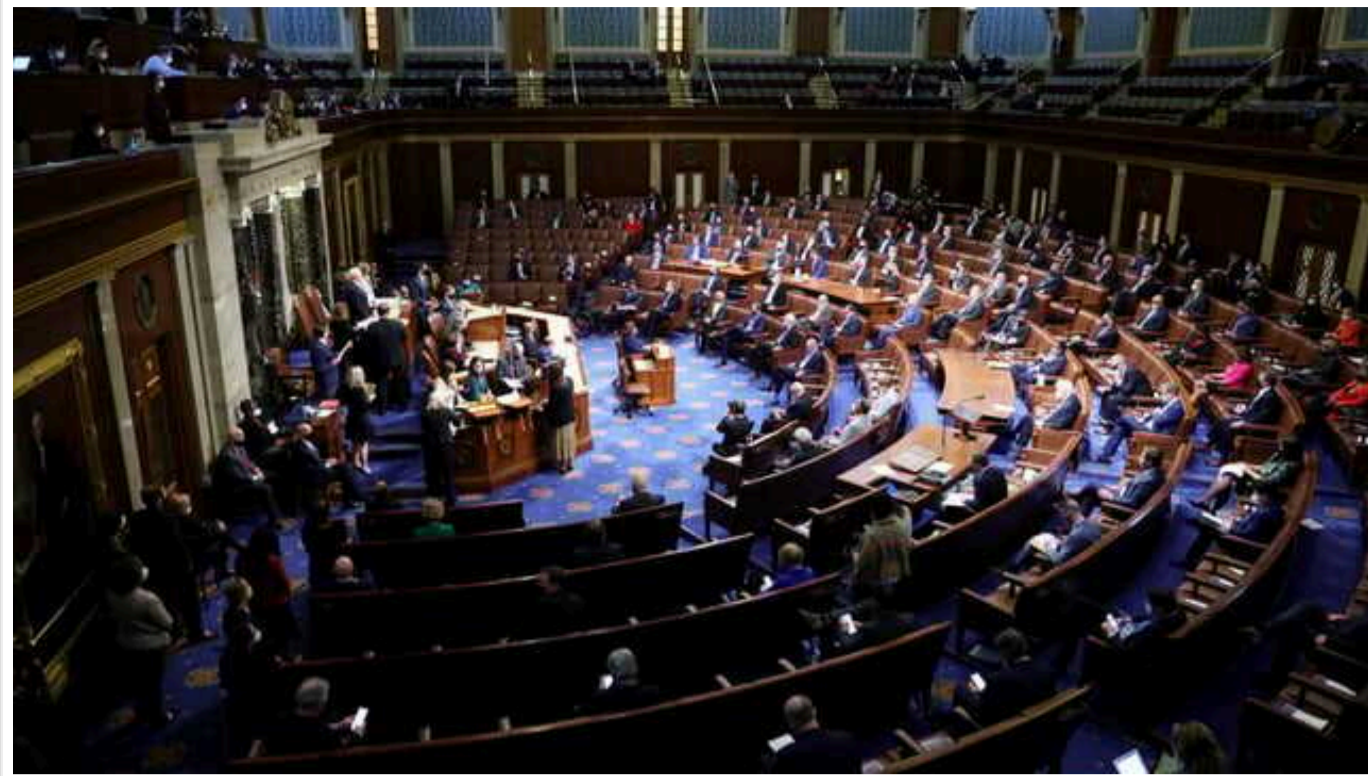
У США Палата представників ухвалила законопроект для запобігання шатдауну

Палата представників США 29 лютого схвалила законопроект про короткострокове фінансування, який дозволить відвернути шатдаун – призупинення роботи установ федерального уряду – до кінця тижня.