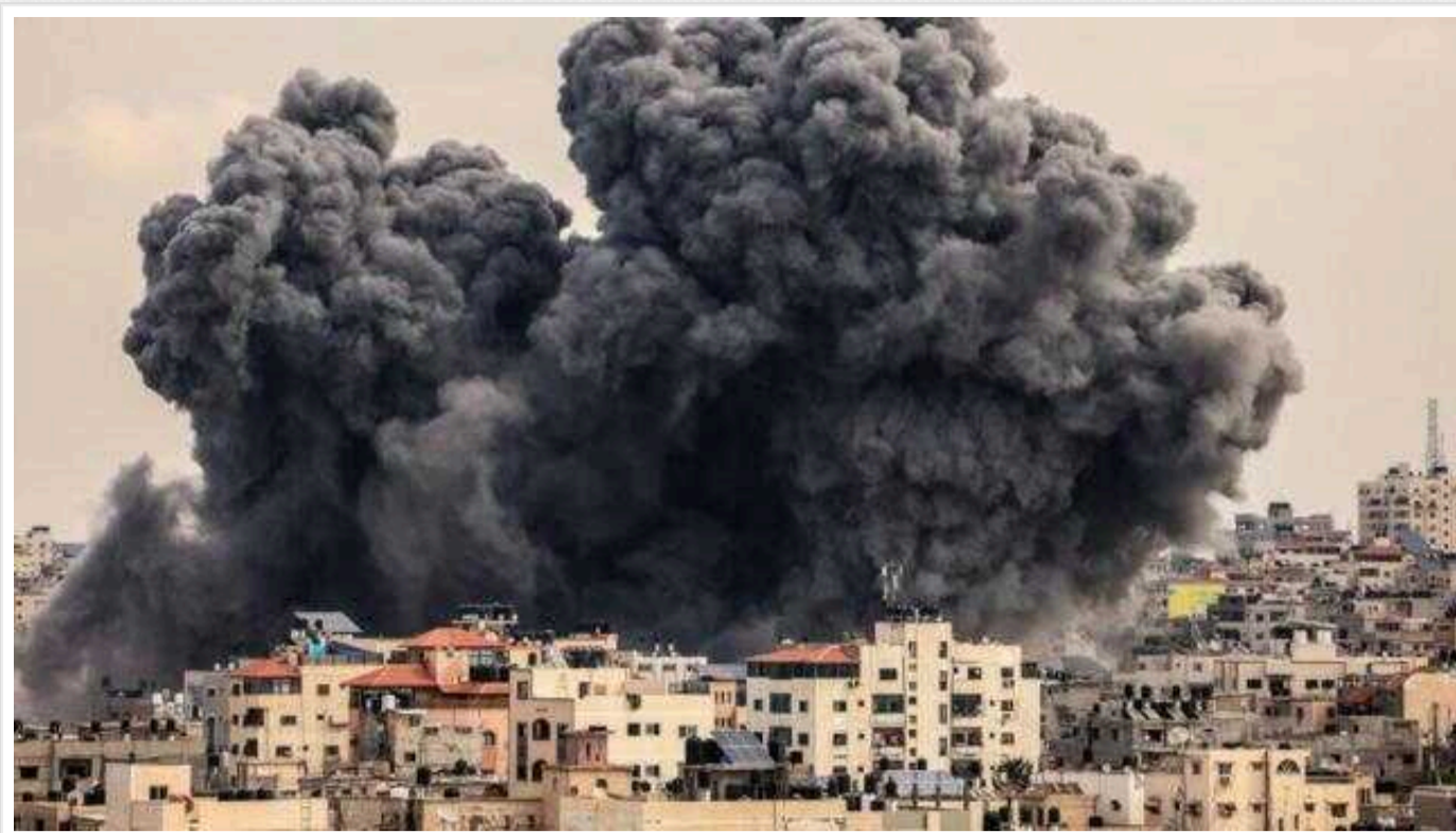
Від початку операції Ізраїлю проти ХАМАСу в Секторі Гази загинули 25 тисяч жінок і дітей, – Пентагон

Міністр оборони США Ллойд Остін заявив, що внаслідок військової операції Ізраїлю в Секторі Гази у відповідь на атаку з боку терористичного угруповання ХАМАС загинули понад 25 тисяч палестинських жінок і дітей.