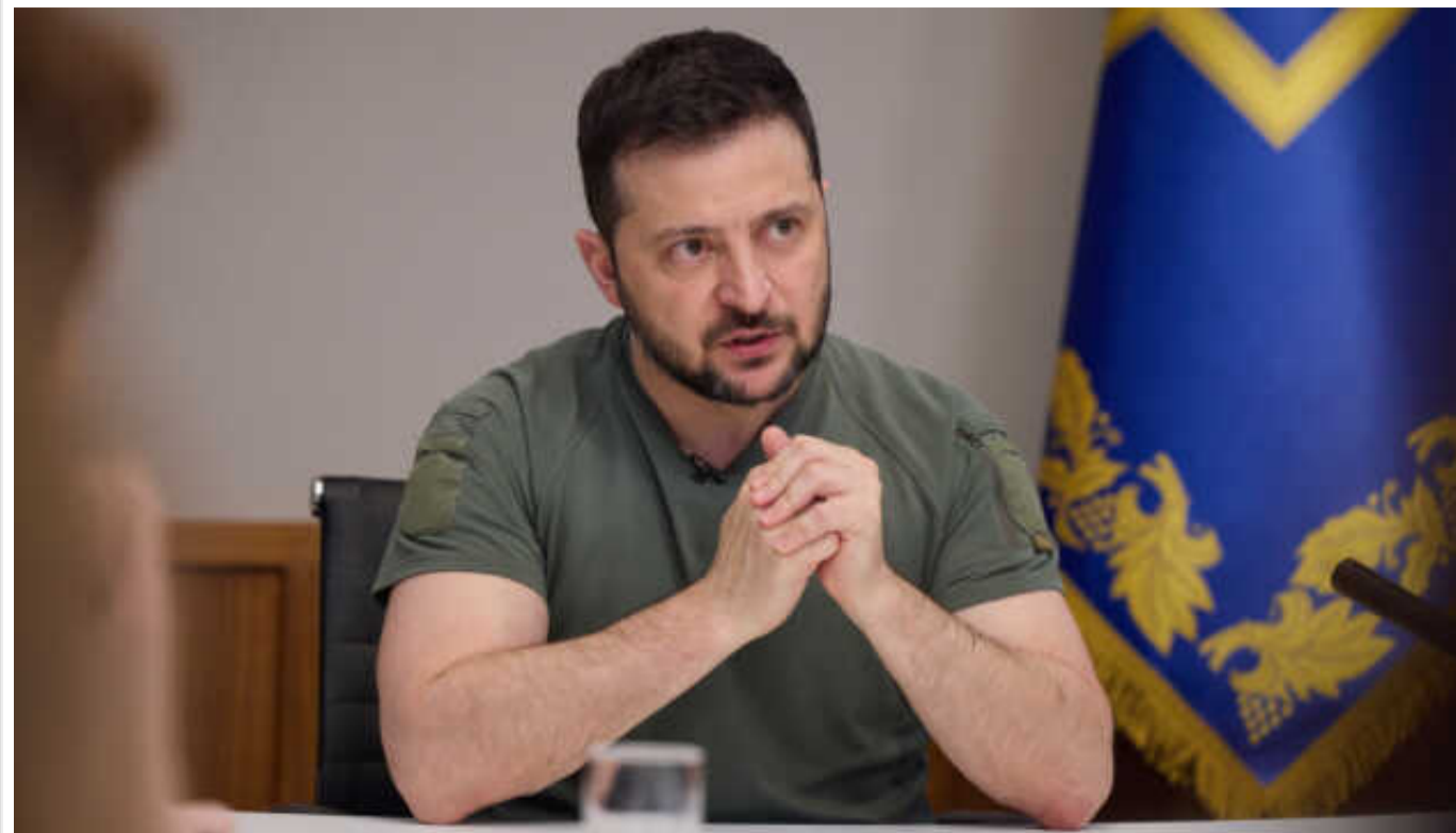
Президент запустив процедуру відбору суддів до Конституційного суду

Український президент Володимир Зеленський запустив процедуру відбору суддів до Конституційного суду.