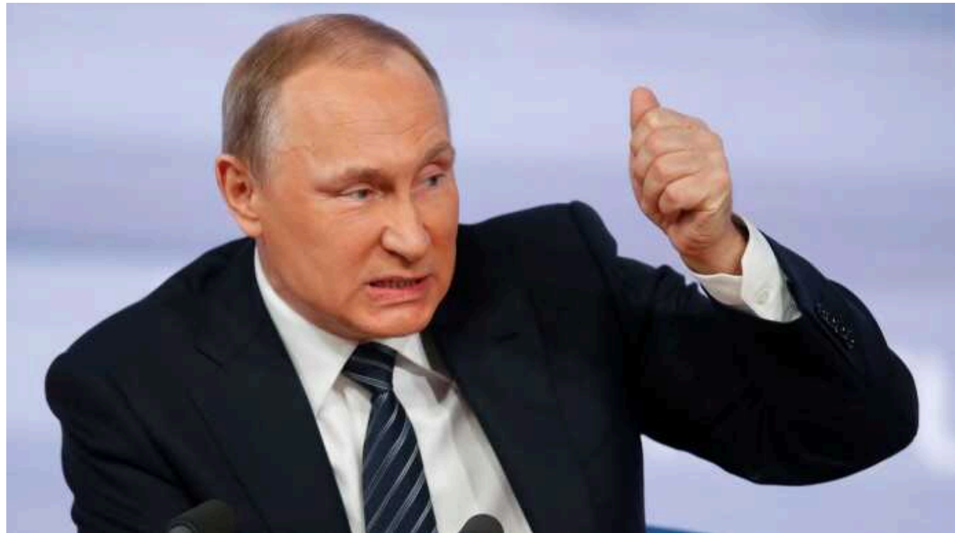
У США відреагували на погрози Путіна про застосування ядерної зброї

США вже попередили Росію про наслідки застосування ядерної зброї. Погрози з боку російського диктатора Володимира Путіна безвідповідальні.