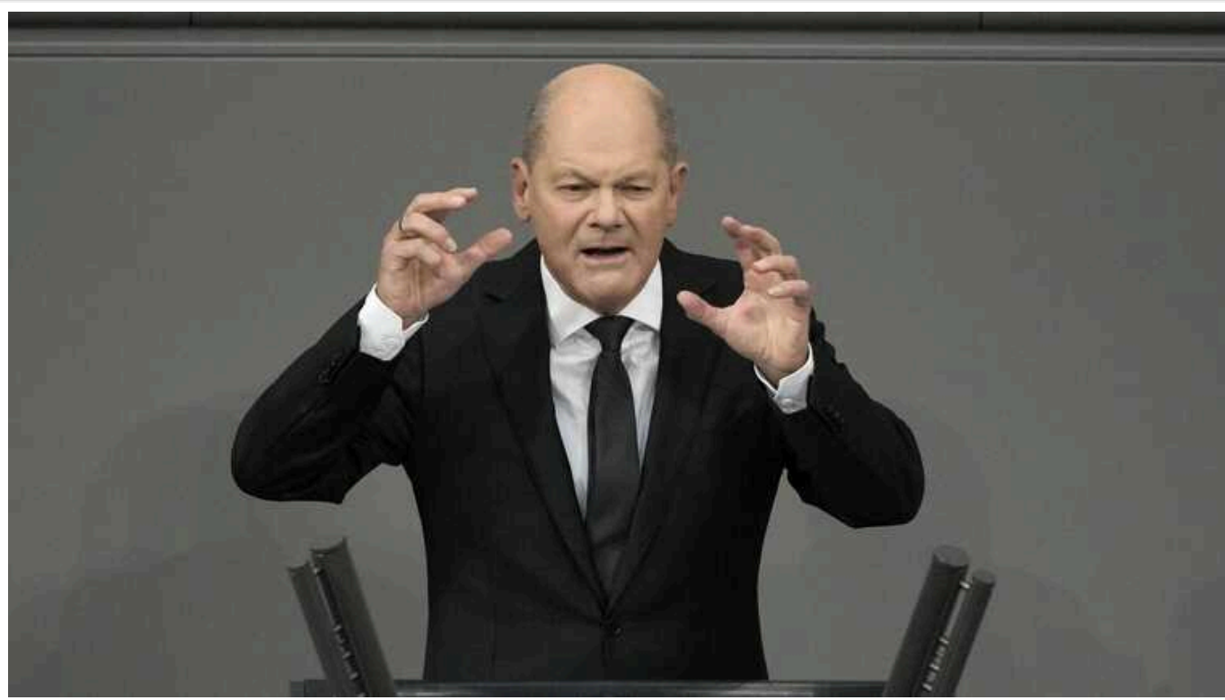
Канцлер Німеччини Шольц вигадав нове виправдання відмові передавати Україні Taurus

Німеччина не готова передавати Україні далекобійні ракети Taurus, оскільки за допомогою них можна здійснювати удари по Москві.