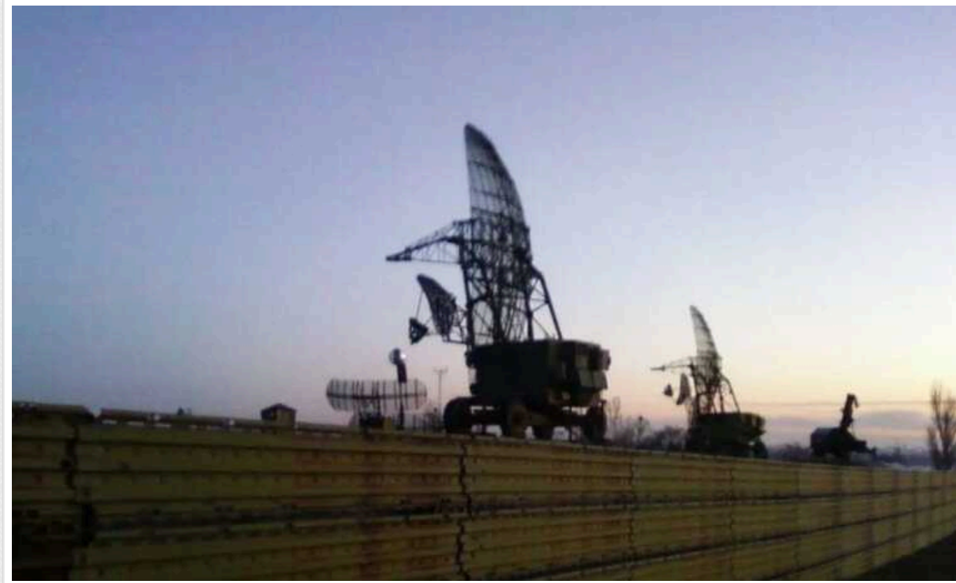
Партизани з "АТЕШ" розвідали у Севастополі місце розташування російських РЛС

Партизани виявили на території тимчасово окупованого Росією Севастополя два радіолокаційні комплекси 5Н87 окупаційних російських військ. Системи розташовані у районі аеродрому "Бельбек", де загарбники тримають свою тактичну авіацію.