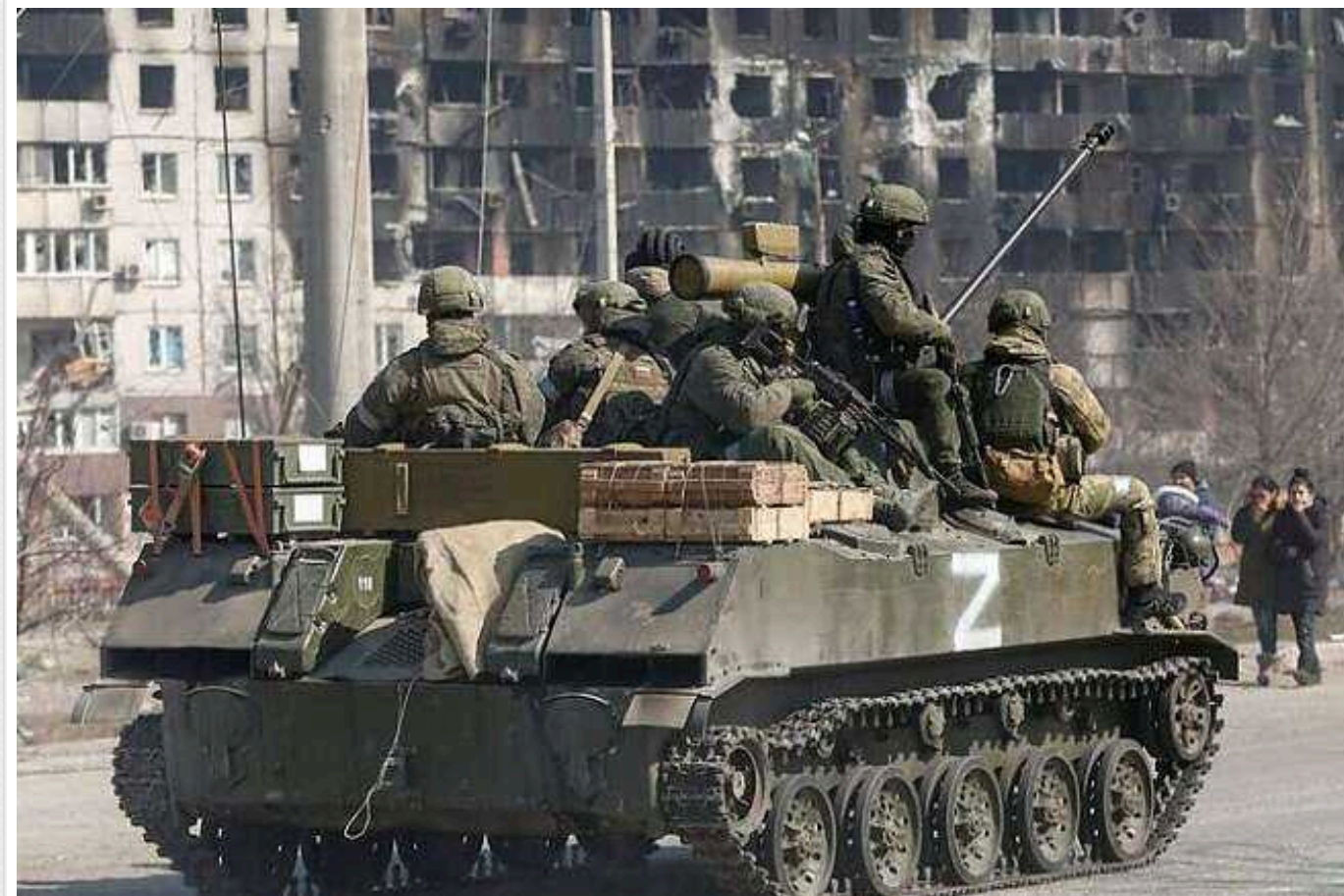
РФ намагається наростити темп операцій біля Авдіївки, – розвідка Британії

Російські окупанти зосередили свої основні наступальні зусилля на території, яка знаходиться на захід від Авдіївки. Ворог зараз намагається скористатися тим фактом, що після втрати цього міста в українських сил немає добре захищених позицій для здійснення оборони.