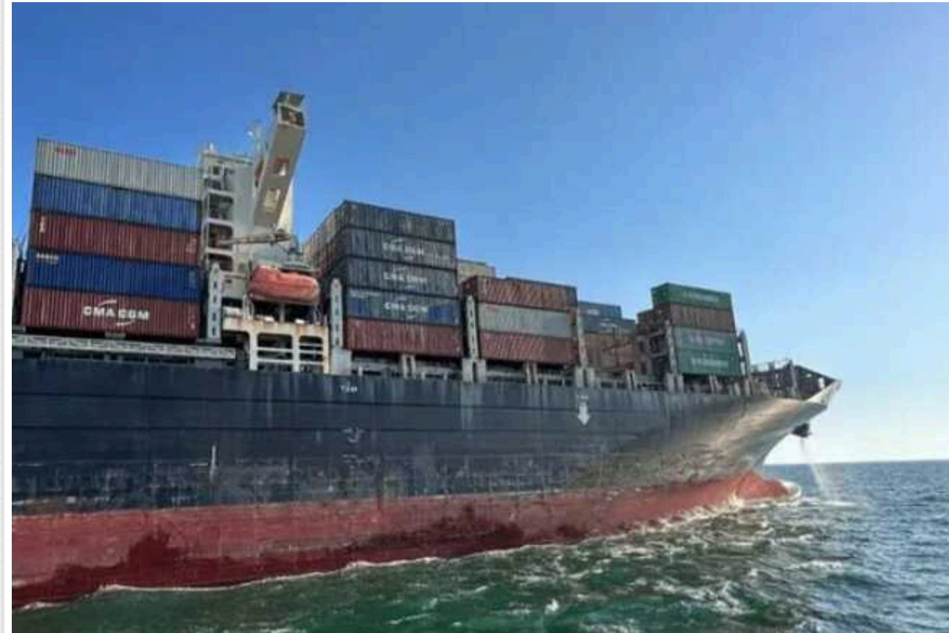
Україна нарощує обсяги експорту Чорним морем: 70% продукції – сільськогосподарське збіжжя

Попри системні повітряні атаки тимчасовий коридор Чорним морем працює і нарощує ефективність. Від початку його роботи у серпні було відправлено майже 27 мільйонів тонн вантажів, 70% якого – українська агропродукція.