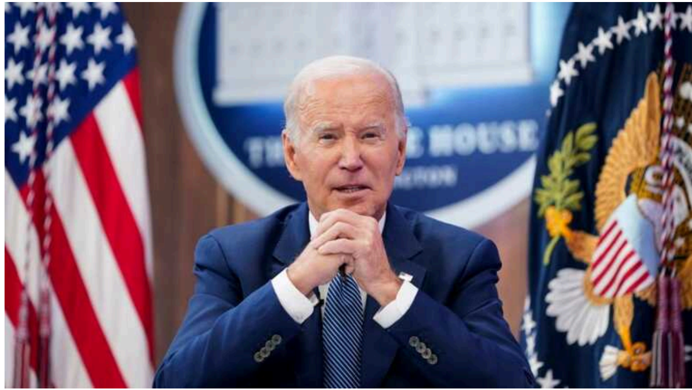
Байден хоче, щоб країни G7 розробили план використання російських активів на користь України, – Bloomberg

Президент США Джо Байден хоче, щоб країни G7 досягнули прогресу щодо планів використання арештованих російських суверенних активів на підтримку України до їхнього саміту в червні 2024 року.