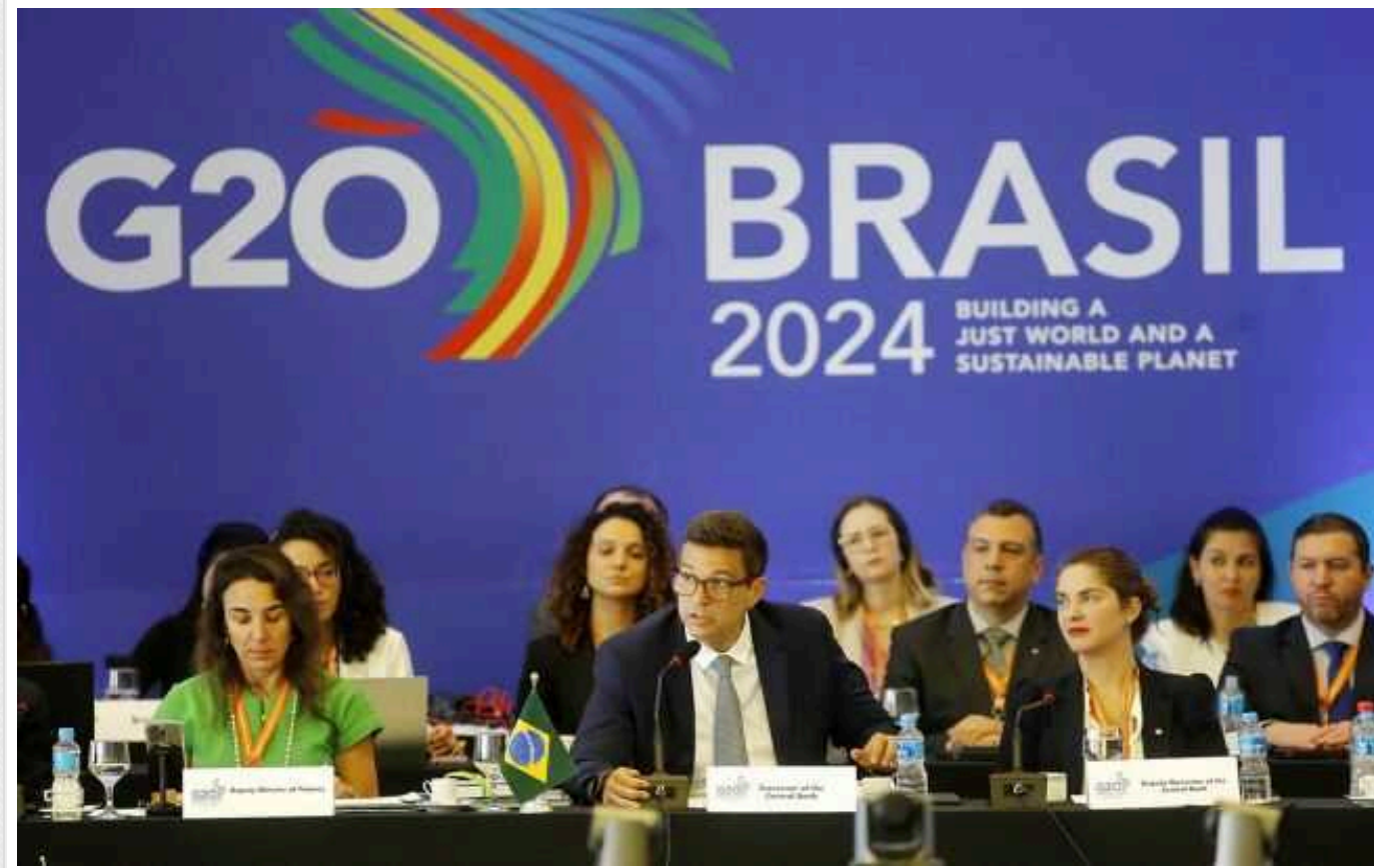
Reuters: Міністри фінансів країн G20 розходяться в поглядах щодо війни в Україні

Глави Мінфінів країн G20 все ще обговорюють, як описати війни в Україні та в Секторі Гази в спільному комюніке.