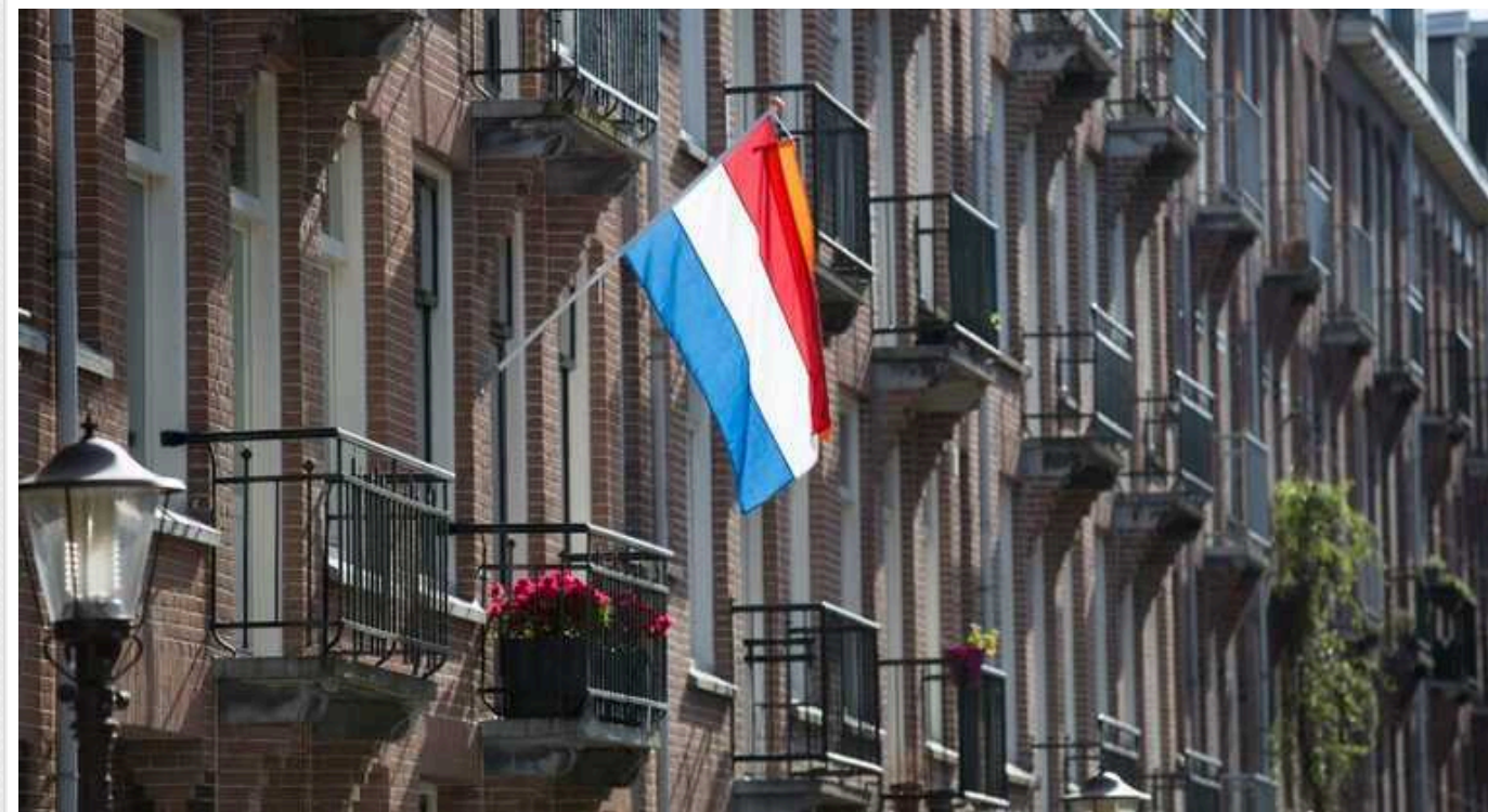
Майже половина нідерландців підтримують відправку військ в Україну

Опитування Hart van Nederland показало, що за цю ідею виступають 44% населення Нідерландів (опитано було 2063 учасників групи).