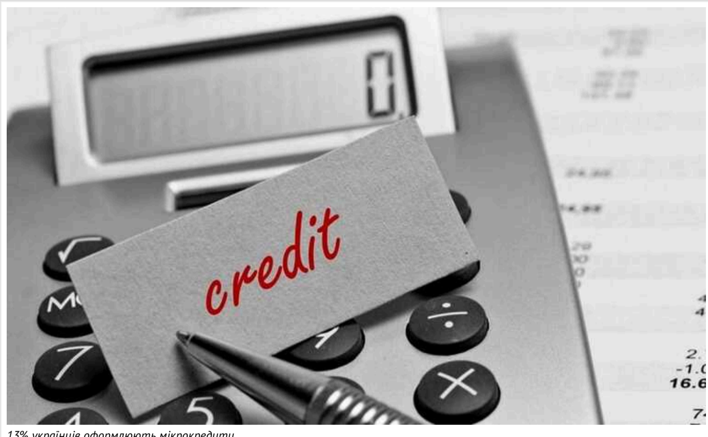
13% українців оформлюють мікrokредити

Послугами мікрофінансових організацій (МФО) користуються близько 13% дорослого населення України, при цьому частка позичальників, які беруть кредит із метою забезпечення щоденних потреб в очікуванні наступної зарплати, збільшилася з 42% до 2022 року до 67%.