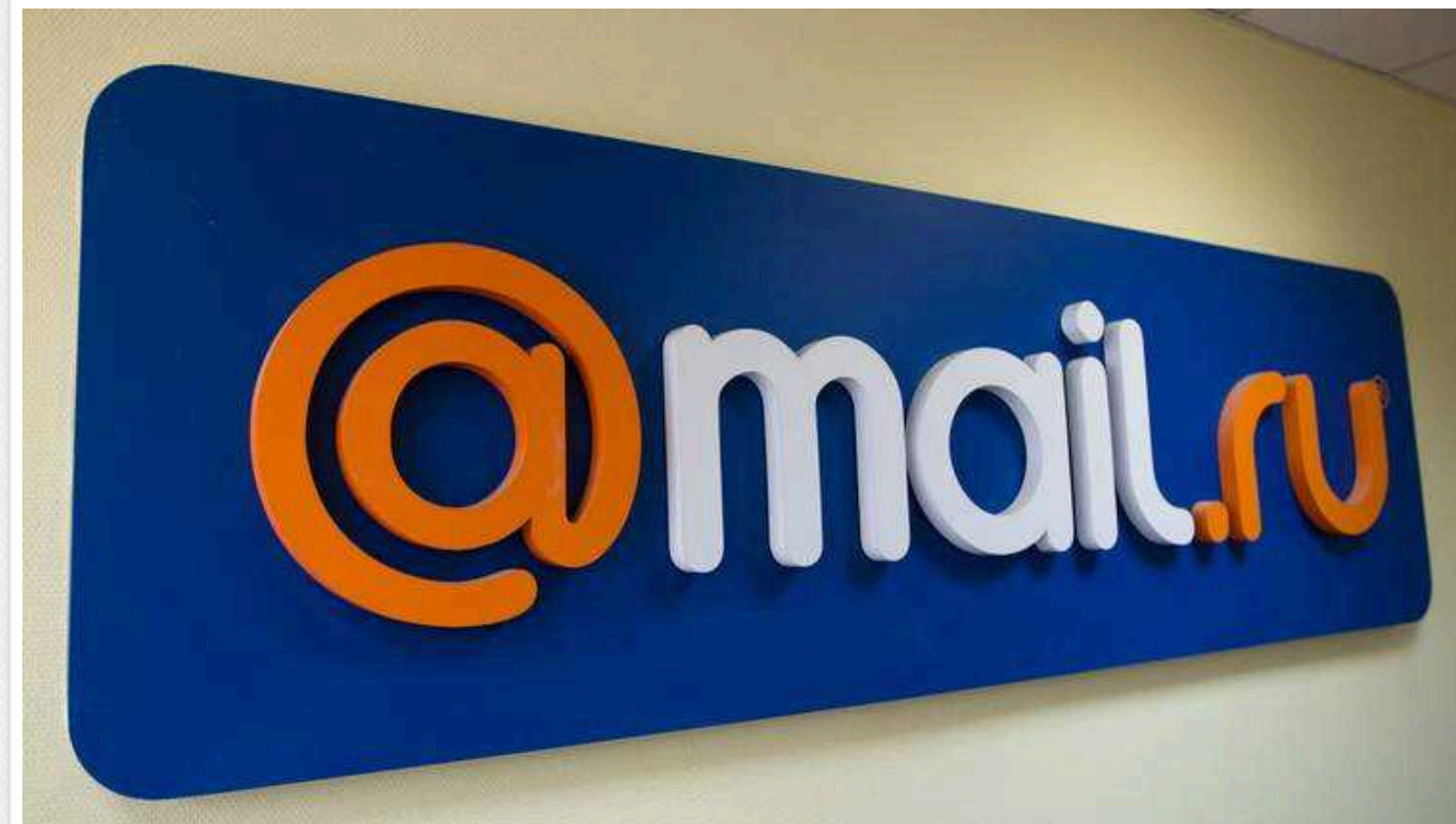
Українські хакери атакували найбільший інтернет-портал РФ "Mail.ru"

Українські хакери атакували найбільший інтернет-портал у Росії «Mail.ru».