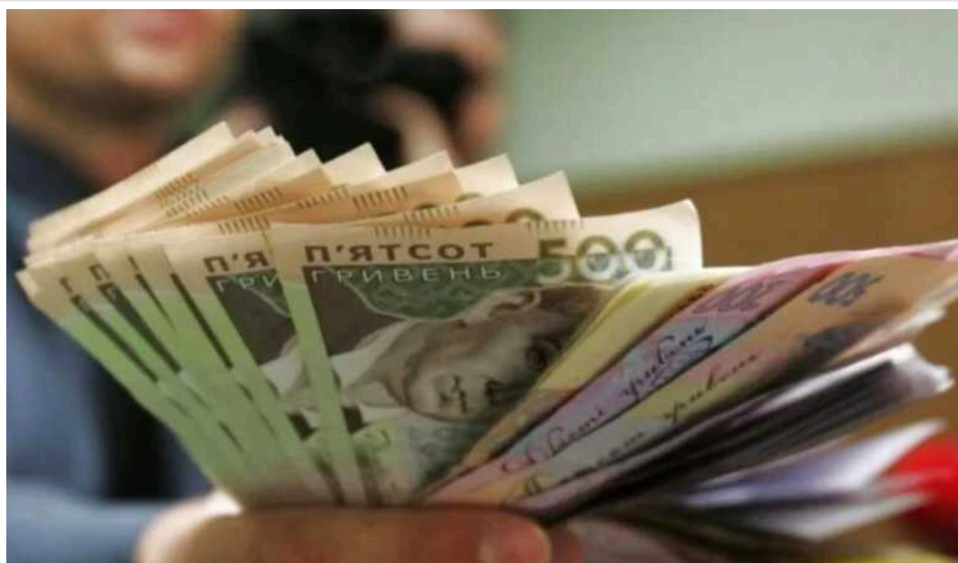
Зарплати більші, безробіття менше: яких змін очікує ринок праці в Україні у 2024 році

У Національному банку України прогнозують, що реальні зарплати в Україні збільшуватимуться, оскільки серед роботодавців зростатиме конкуренція за кваліфікованих працівників.