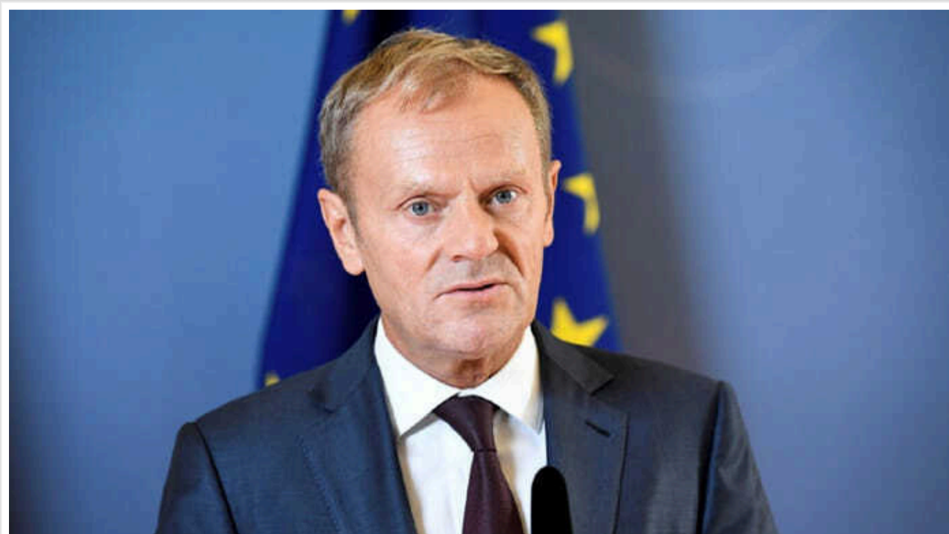
"Заяви Путіна слід сприймати серйозно", - Туск

За словами польського прем'єра, позиція РФ зобов'язує Захід "прокидатися" і готуватися з військової точки зору до потенційних загроз.