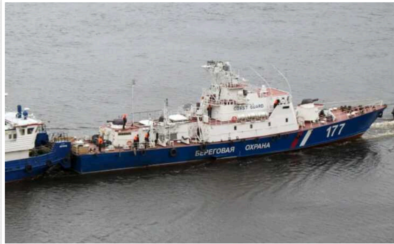
В Азовському морі знезацька спалахнуло судно ФСБвців: є загиблі, – ГУР

Вогонь охопив рубку російського катера, а екіпаж терміново запросив евакуаційну групу.