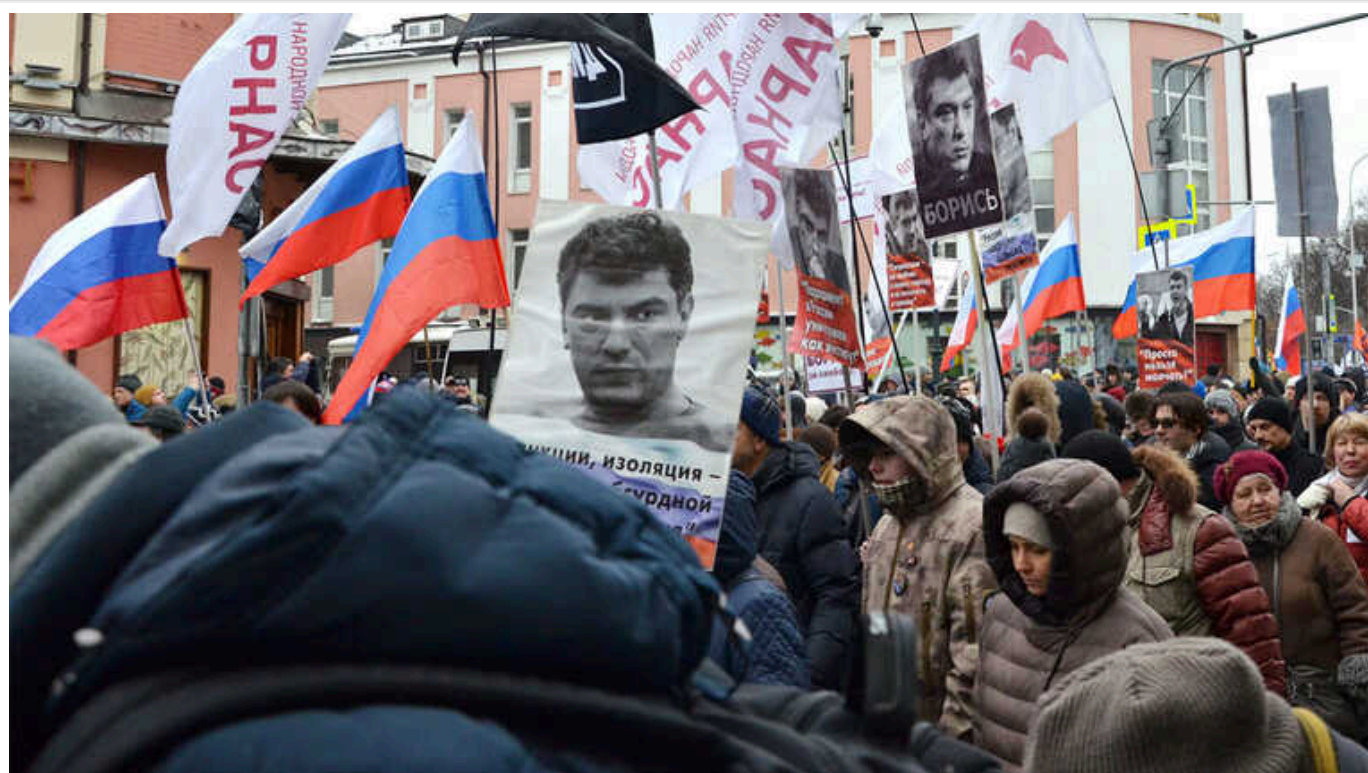
У Москві мерія не дозволила провести ходу пам'яті Навального та Немцова, - російська опозиція

Демонстрацію, як ми писали, хотіли провести у суботу. Заявлена чисельність – 50 тисяч осіб.