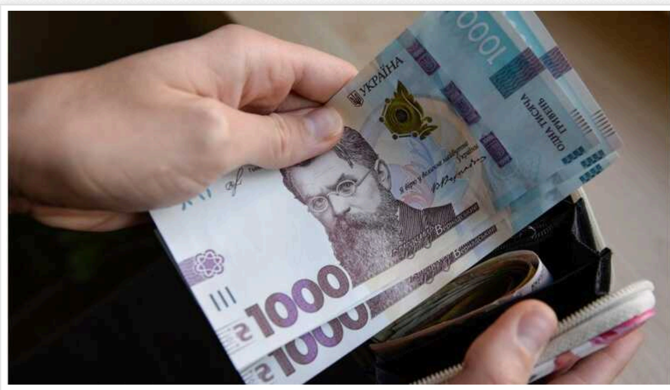
З початку війни середня зарплата в Україні зросла майже на третину, – інфографіка

З 2022 по 2024 роки ЗП зросла на 30% або 4,5 тисячі гривень і становить на початок 2024 року 19,5 тисяч гривень.