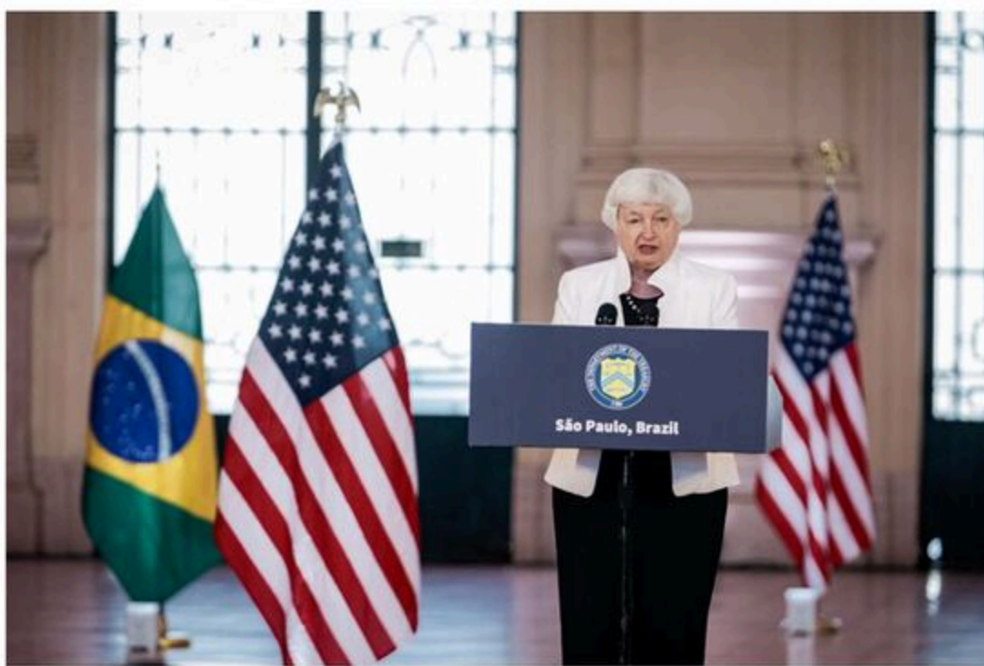
The US has been leading the push, with Treasury Secretary Janet Yellen this week saying the legal and moral case is strong, and seeking to assuage European doubts.