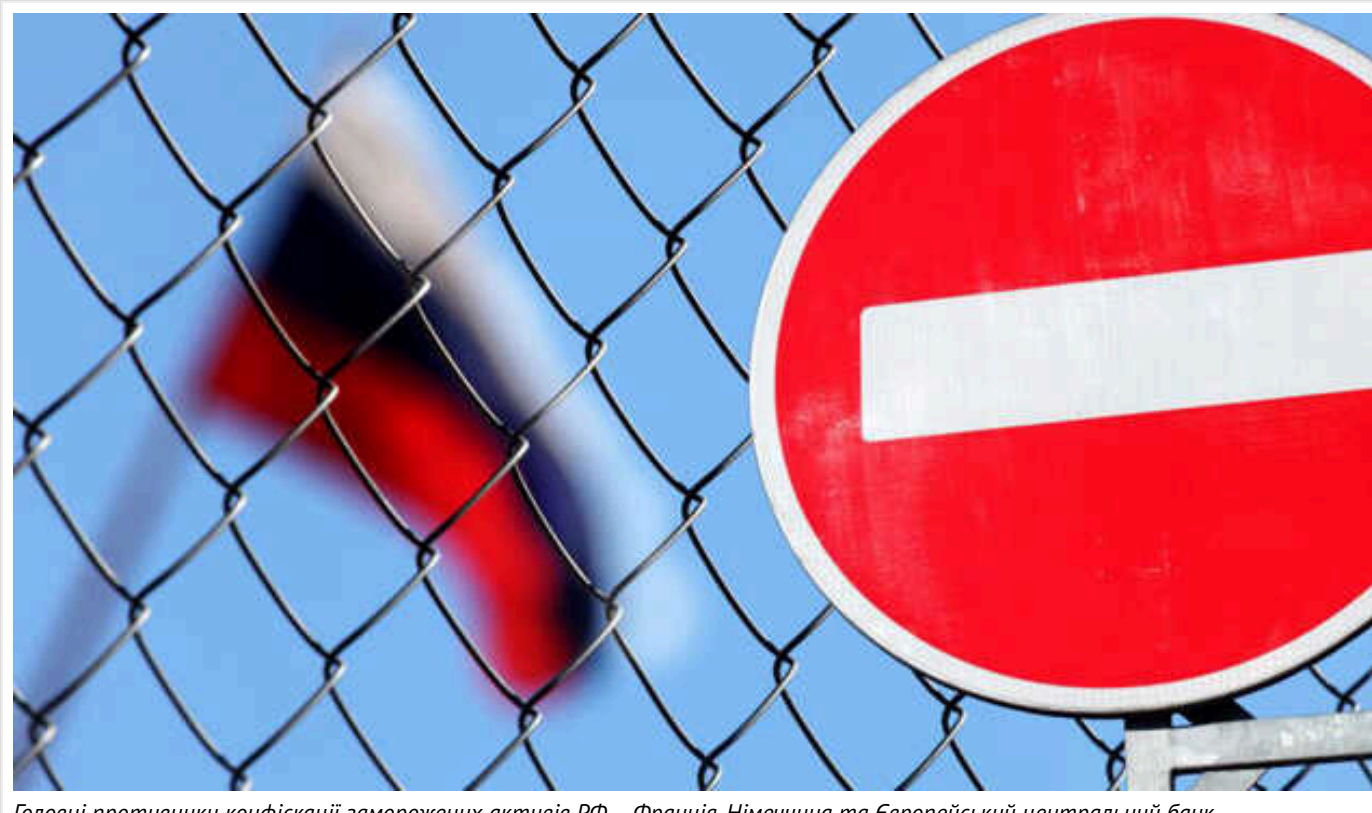
Головні противники конфіскації заморожених активів РФ – Франція, Німеччина та Європейський центральний банк

Про це повідомляє Bloomberg із посиланням на джерела.