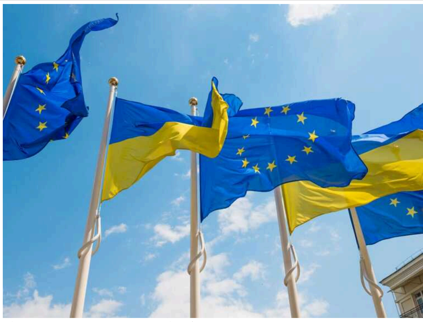
В Євросоюзі наголосили, що ніколи не визнають "вибори" РФ на окупованих територіях України

Європейській Союз вважає проведення Росією так званих виборів президента на тимчасово окупованих територіях України порушенням міжнародного права та ніколи не визнає їхніх результатів.