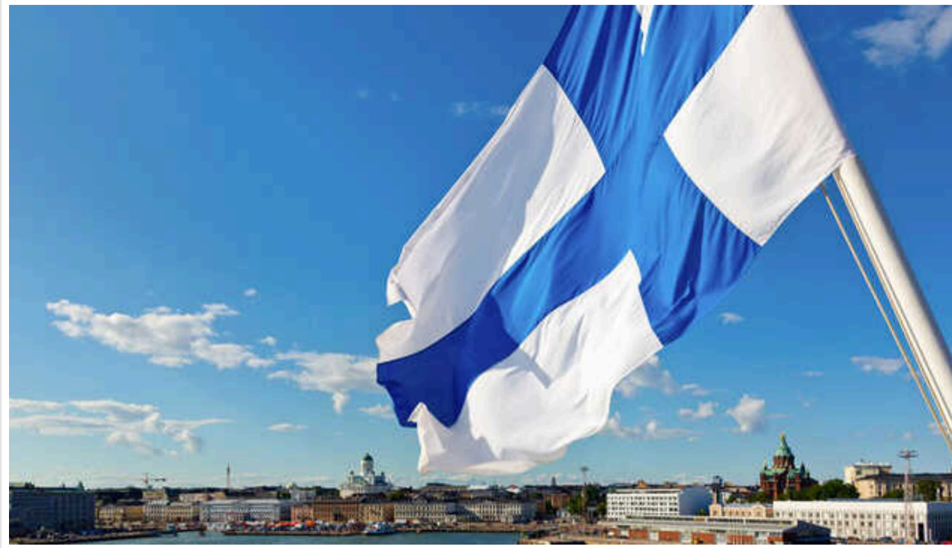
У Фінляндії заявили, що доходи від російських активів слід використати на озброєння України

Міністр закордонних справ Фінляндії Еліна Валтонен заявила, що дохід від заморожених російських активів слід використати для озброєння України.