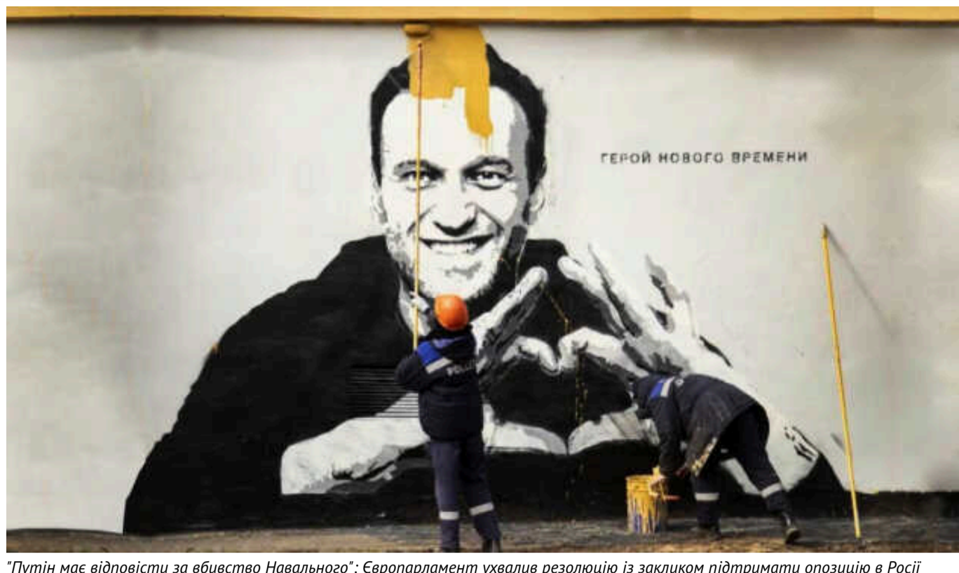
"Путін має відповісти за вбивство Навального": Європарламент ухвалив резолюцію із закликом підтримати опозицію в Росії

Європейський парламент ухвалив резолюцію "Про вбивство Олексія Навального та необхідність дій ЄС на підтримку політів'язнів та пригніченого громадянського суспільства в Росії". Депутати заявили, що кремлівський диктатор Володимир Путін має відповісти за вбивство.