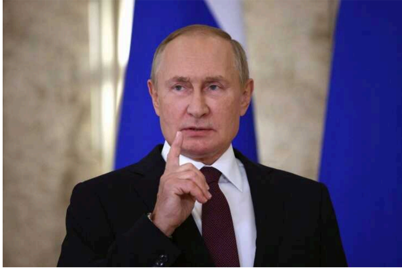
Путін не відмовився від своєї початкової мети захопити великі міста, включаючи Київ та Одесу, - Bloomberg

Видання пише, що стратегія України полягає в тому, щоб спробувати утримувати лінію фронту якнайдовше до другої половини року.