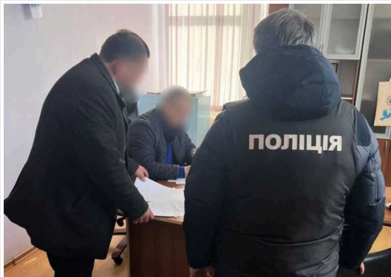
На Одещині директор лікарні придбав уживану систему опалення за завищеною ціною

На Одещині директорів лікарні повідомили про підозру за придбання системи опалення за завищеними цінами.