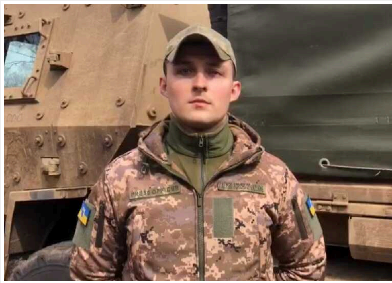
"Росіяни наступають у бік Часового Яру на Бахмутському напрямку", - Євлаш

Про це повідомляє речник Східного угруповання військ Ілля Євлаш.