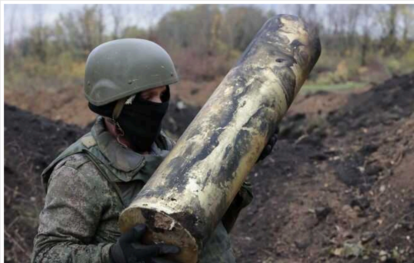
У РФ визнали, що свідомо б'ють по житлових районах Курахового

Російська пропаганда зізнається, що війська РФ свідомо б'ють по критичній інфраструктурі у Кураховому.