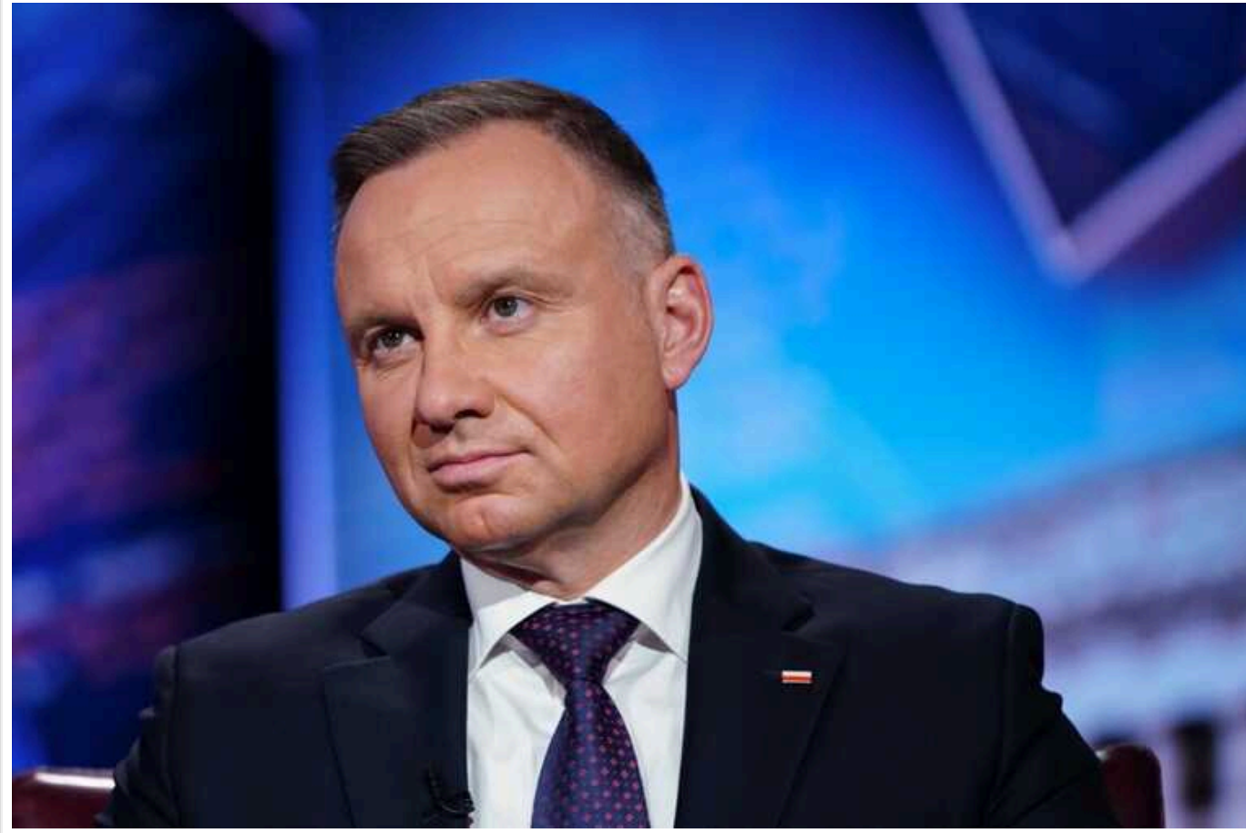
Анджей Дуда не вірить у напад РФ на країни НАТО: "Я не вірю в це, тому що вірю, що ми підготуємося"

Президент Польщі Анджей Дуда не вірить у напад РФ на країни НАТО, тому що переконаний, що вони встигнуть підготуватися до цього.