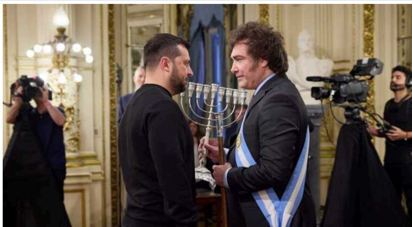
Президент Аргентини, який подарував Україні два військові вертольоти, анонсував новий захід на підтримку Києва

Президент Аргентини Хав'єр Мілей заявив, що планує провести саміт латиноамериканських країн на підтримку України. Ідею цього заходу він обговорював із українським лідером Володимиром Зеленським під час зустрічі у 2023 році.