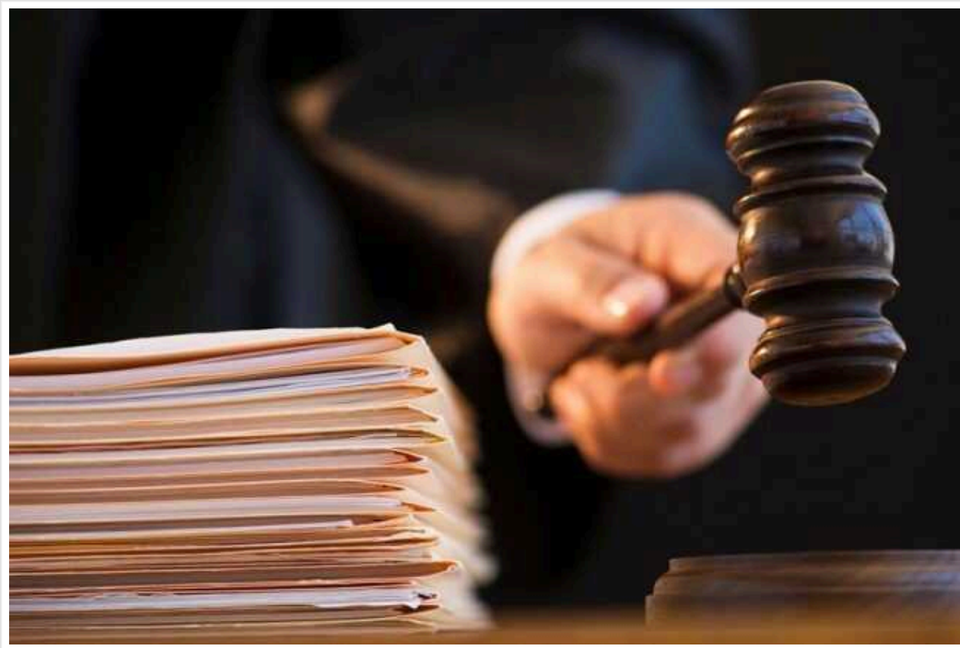
В Україні судитимуть російського окупанта, який катував цивільного на Київщині

Судитимуть сержанта збройних сил РФ, причетного до воєнних злочинів. Окупант катував мирного мешканця Київщини та бив його ногами, навіть коли той впав та втратив свідомість.