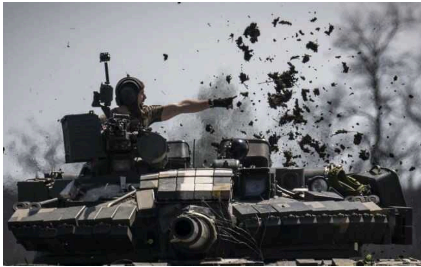
У ЗСУ пояснили, як погодний фактор може вплинути на ситуацію на фронті навесні: «Цей час можна виграти»

Весняна погода може вплинути на ситуацію на фронті, сповільнюючи рух важкої техніки російських окупантів. Така ситуація може надати перевагу українським захисникам.