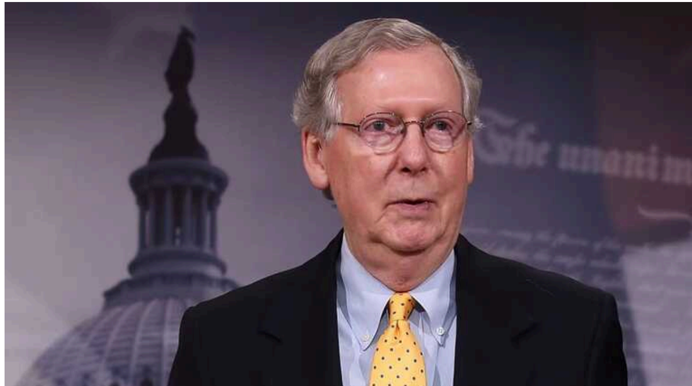
Лідер республіканців у Сенаті США Мітч Макконнелл йде у відставку

Лідер Республіканської партії у верхній палаті Конгресу США Мітч Макконнелл, який відомий підтримкою України, завершує кар'єру. Він планує піти з посади в листопаді 2024 року.