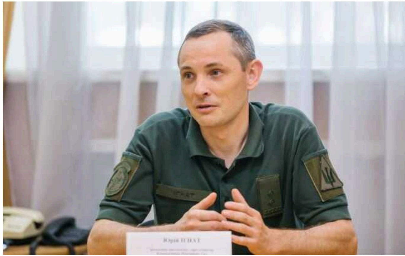
Ігнат пояснив, чому РФ втратила так багато одиниць авіації

Масове збиття російських літаків у лютому 2024 є відповіддю українських Сил оборони на нарощування присутності авіації ворога на сході України.