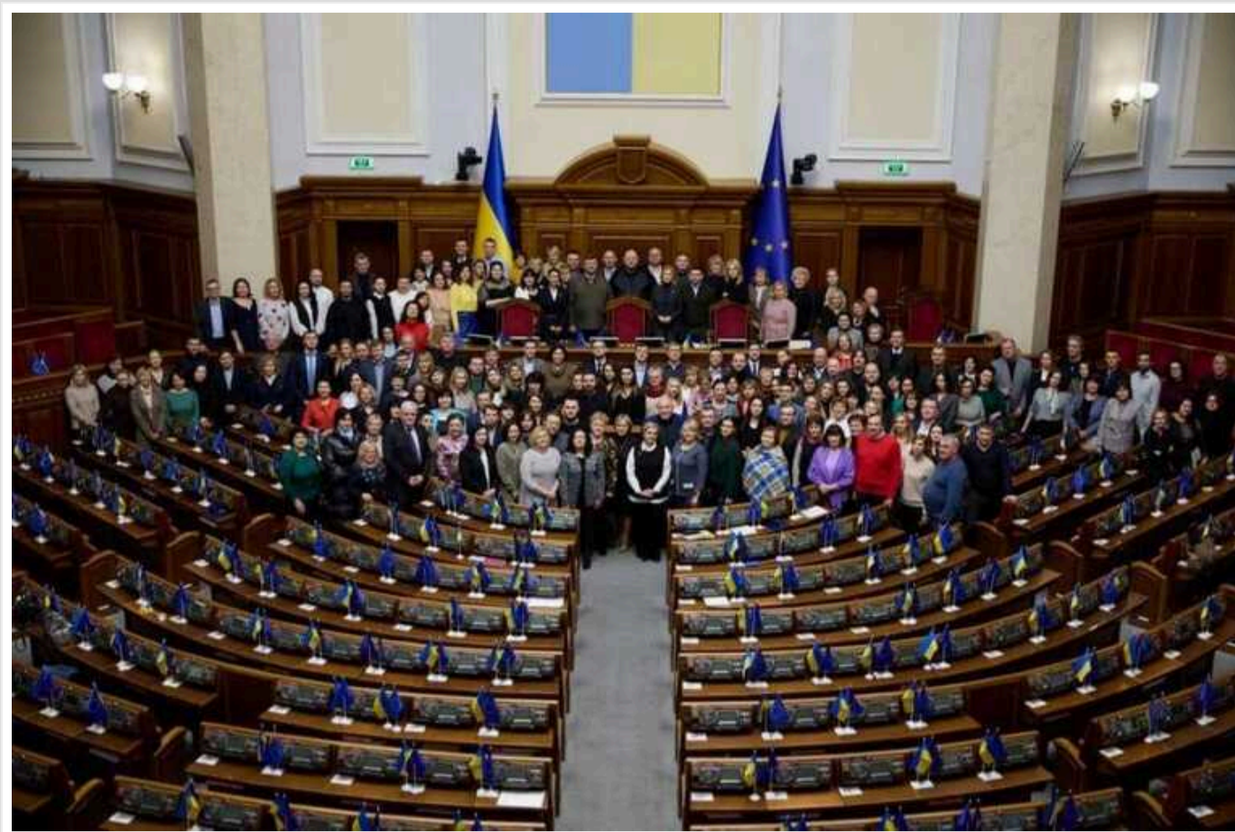
В Україні хочуть дозволити перевірки на мобінг на роботі

У Верховній Раді зареєстрований проєкт закону про розблокування позапланових перевірок за заявою працівника або профспілки з питань вчинення мобінгу на роботі.