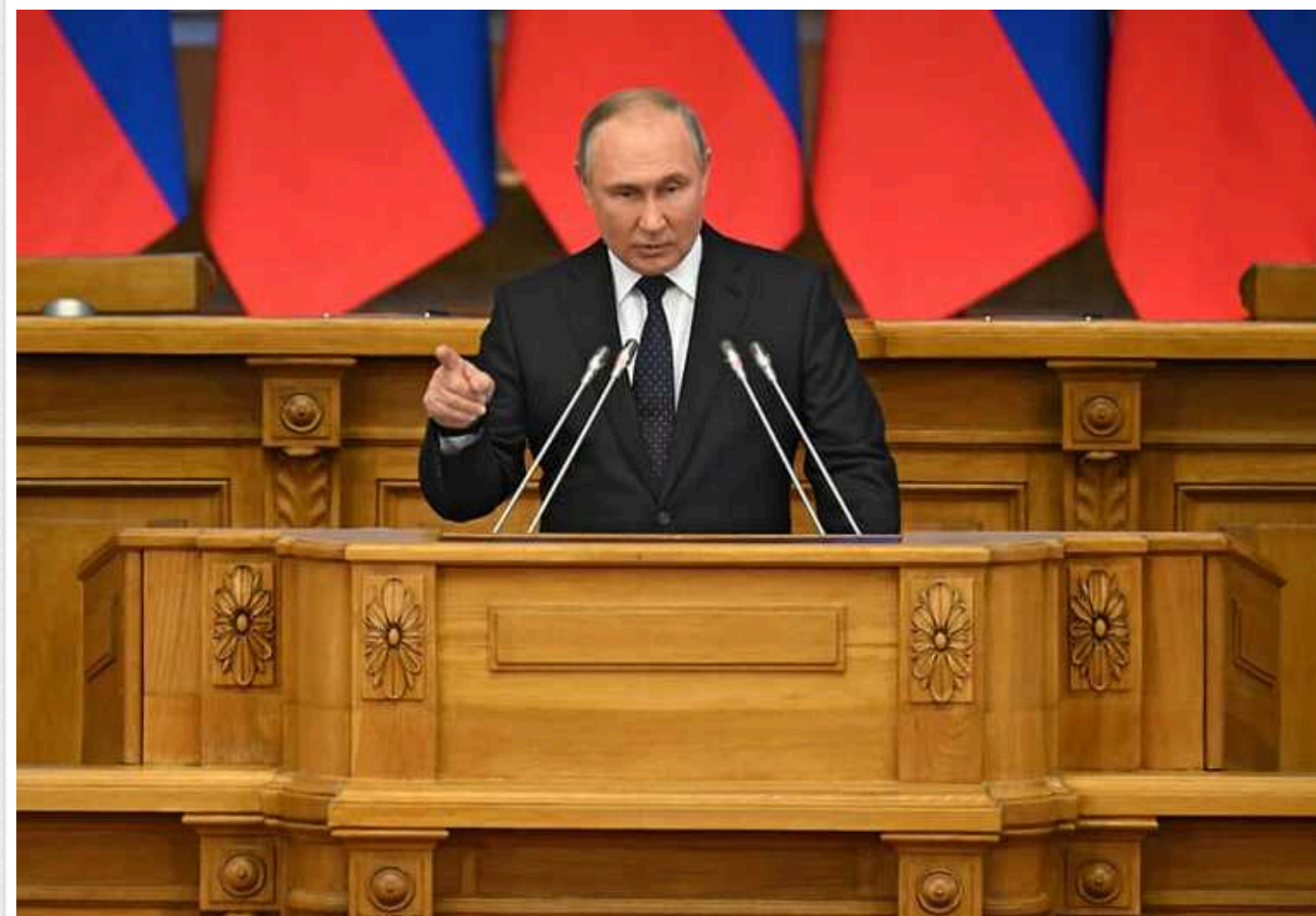
Путін пригрозиє ракетним ударом по країнах, які направлять свої війська до України: «Реально загрожує конфліктом із використанням ядерної зброї»

Путін прокоментував відповідні заяви Макрона (хоча його самого не згадав) і погрожував ракетним ударом по країнах, які направлять війська в Україну.