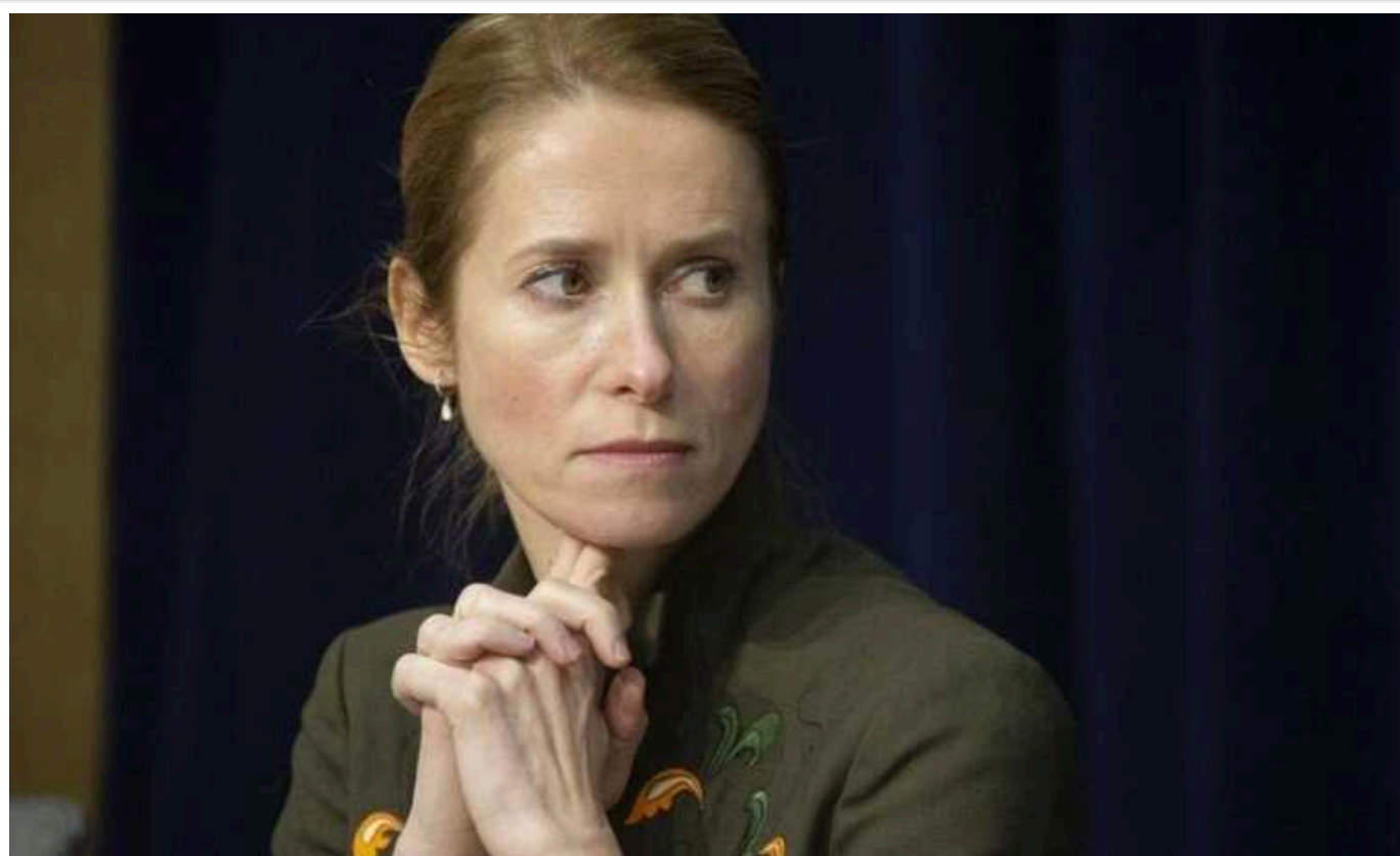
Естонія не виключає відправлення своїх військ до України, – Кая Каллас

Politico пише, що прем'єр Естонії Кая Каллас заявила, що західні лідери не повинні виключати таку можливість.