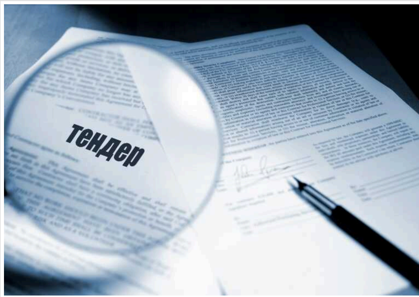
Освітня Рені купили дизельні генератори: ціни завищені вдвічі

Комунальна установа «Центр з обслуговування закладів та установ освіти» Реніської міської ради Одеської області 11 грудня 2023 року за результатами тендеру замовила ТОВ «Аїдіа Тех» генератори на 3,78 млн грн.