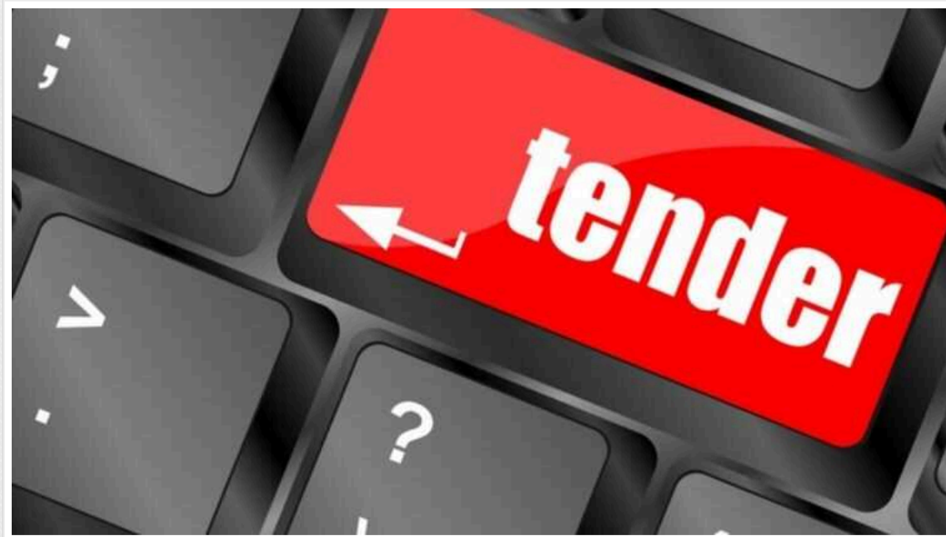
«Центрэнерго» замовило сірчану кислоту на 13% дорожче в доларах, ніж «Херсонська ТЕС»

ПАТ «Центрэнерго» 21 лютого за результатами тендеру замовило ТОВ фірма «Торгсервіс» сірчану кислоту на 20,54 млн грн.