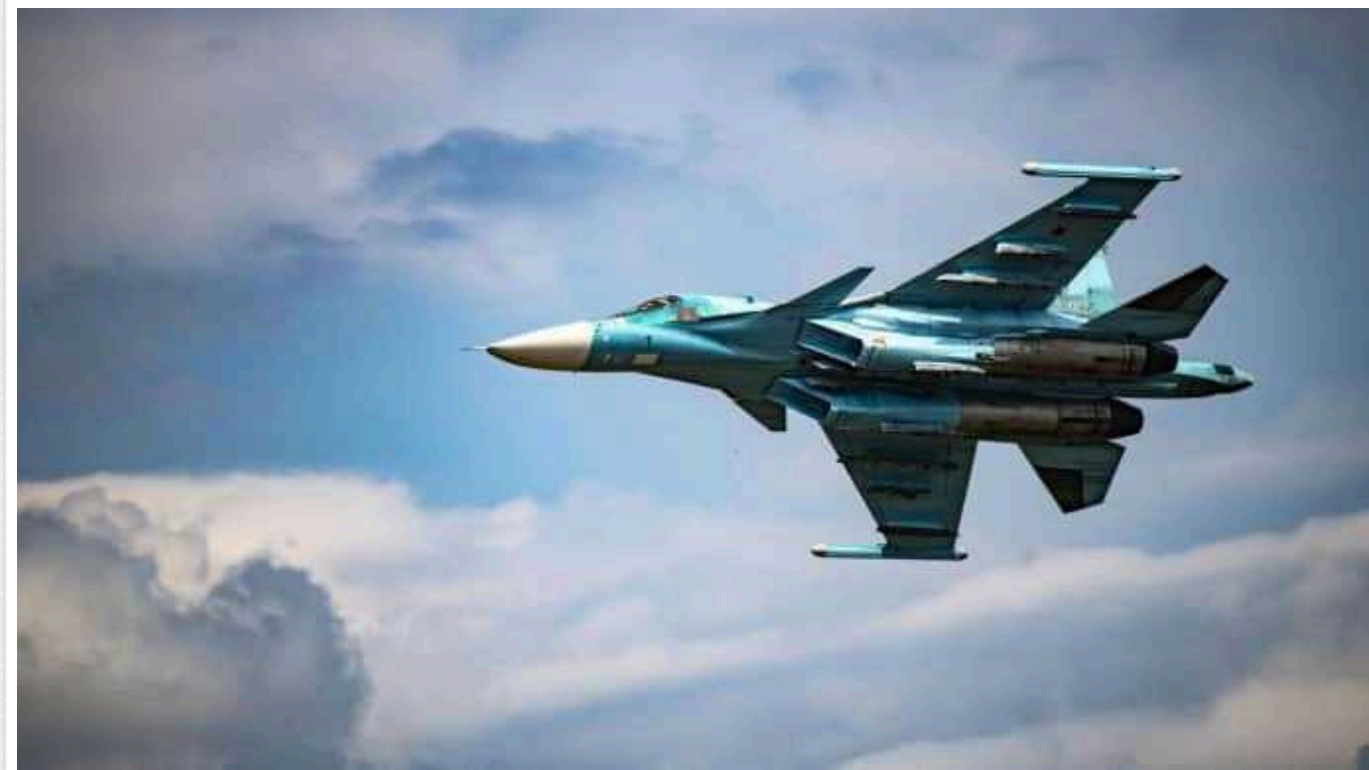
Експерт розповів скільки лишилося у Росії літаків Су-34, які активно «мінусують» ЗСУ

З початку року українські військовослужбовці знищили понад 10 сучасних винищувачів російської окупаційної армії. Однак у країні-терориста залишається досить потужний потенціал військової авіації.