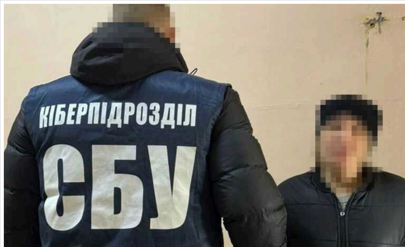
СБУ затримала агентку РФ: наводила російські ракети на Харків і чекала на захоплення міста

Правоохоронці затримали зрадницю, яка наводила російські ракети до Харкова і чекала на захоплення міста. Їй загрожує довічне ув'язнення.