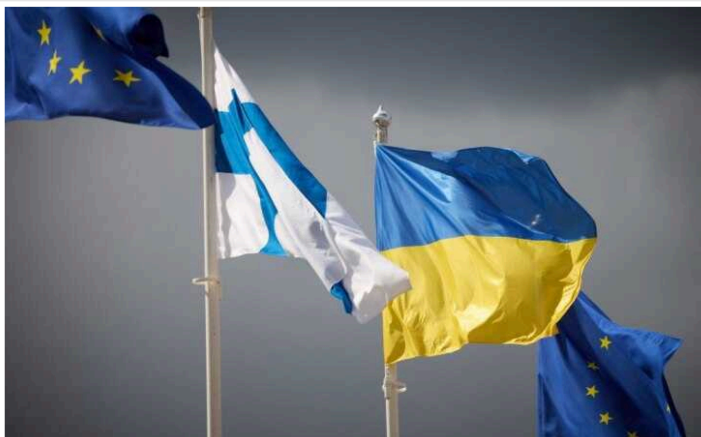
Фінляндія дозволяє використовувати свою зброю для ударів по РФ

Фінляндія не проти використання її зброї для ударів по території Росії.