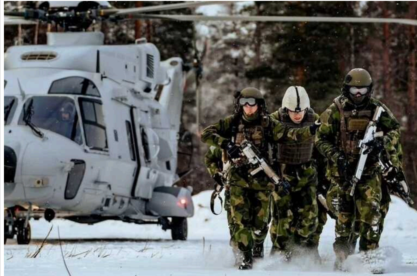
13 північних країн НАТО готуються до масштабних військових навчань з колективної оборони

13 країн-членів і партнерів НАТО готуються до участі в навчаннях Nordic Response 2024, які є частиною серії навчань Steadfast Defender, що відбудуться у Норвегії, Фінляндії та Швеції. У них візьмуть участь понад 20 тисяч військовослужбовців.