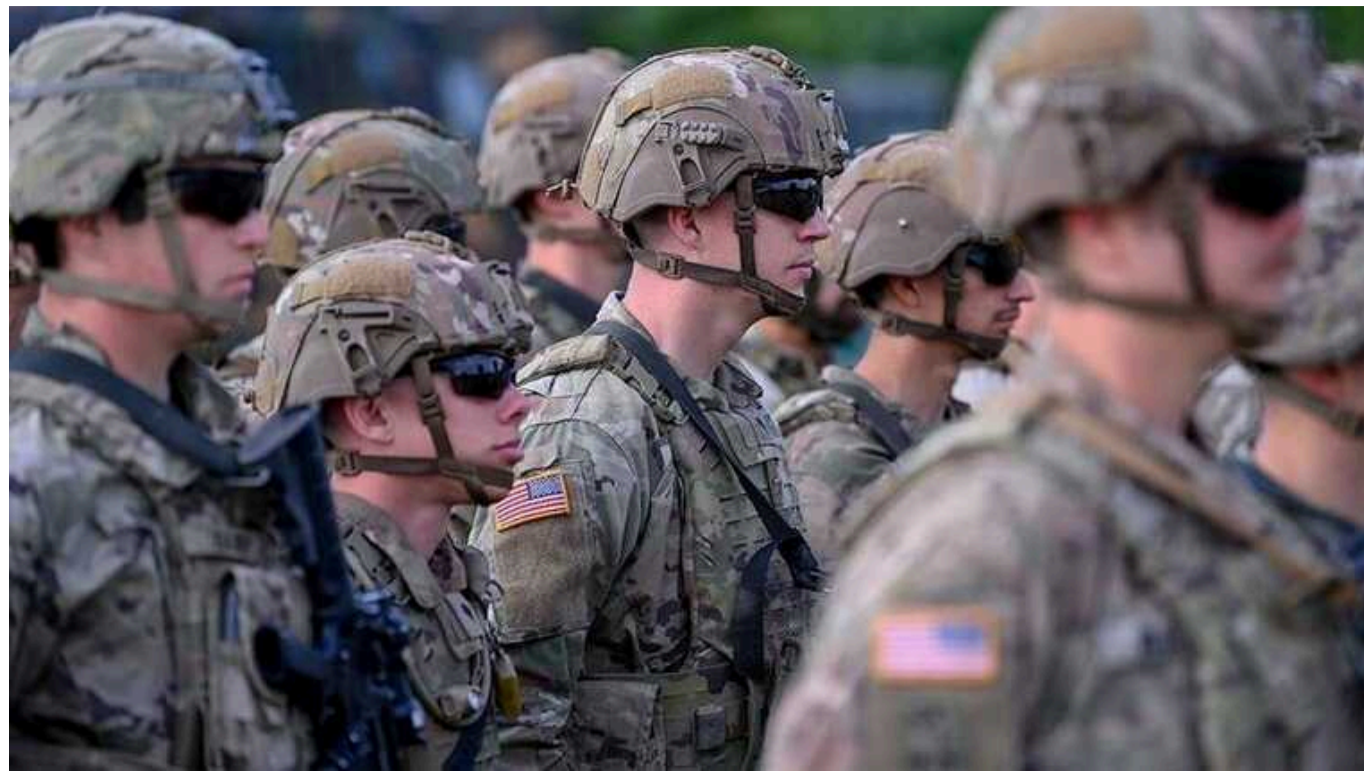
США готуються до можливої великої війни, – AP

Видання AP пише, що армія США готується до можливої великої війни.