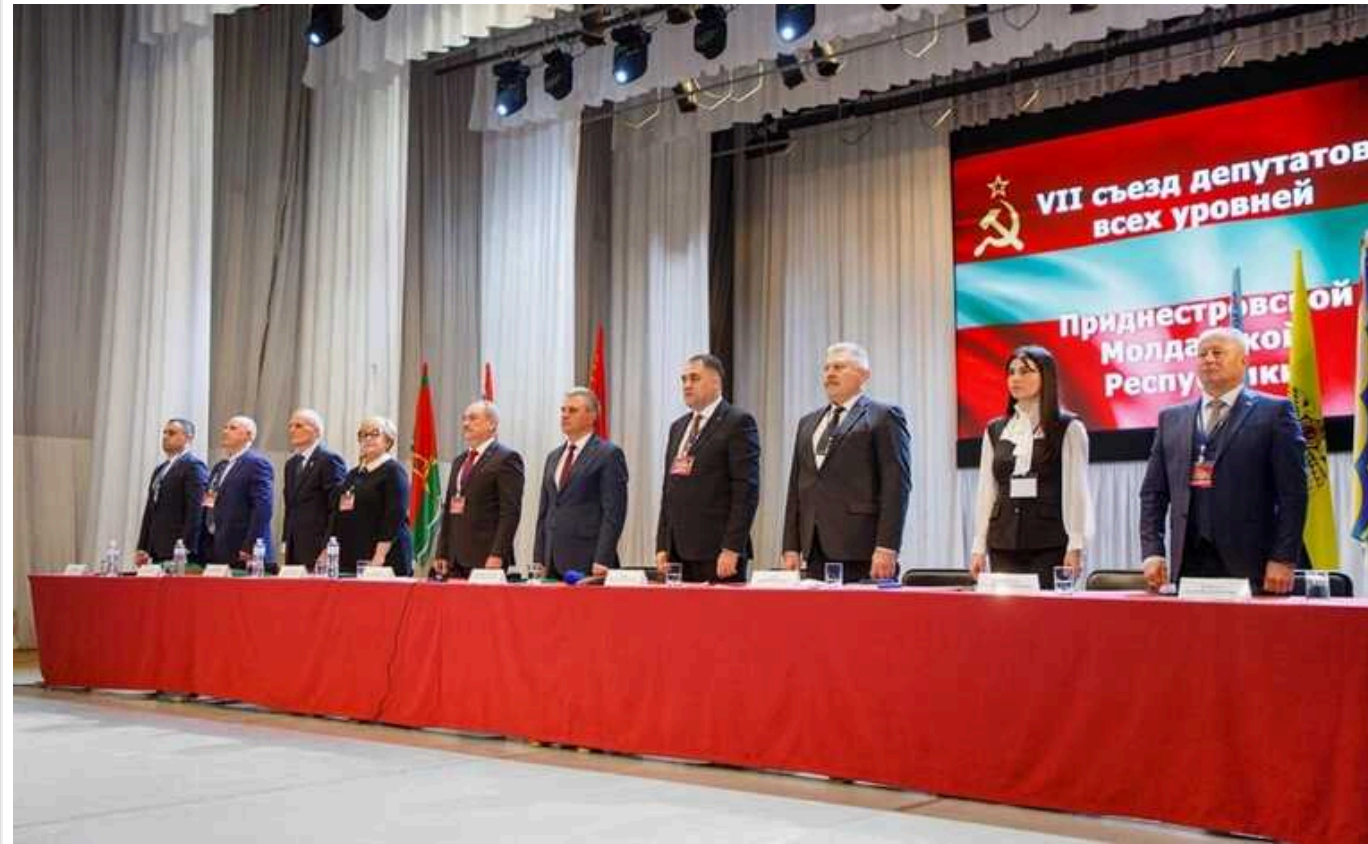
США закликають Кишинів та Тирасполь «працювати разом і знаходити рішення гострих занепокоєнь громад з обох боків»

США прокоментували звернення "депутатів" Придністров'я до РФ та міжнародних організацій з проханням про допомогу у конфлікті з Молдовою.