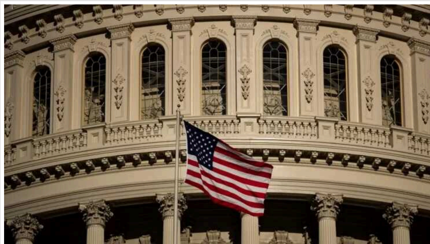
У Конгресі США досягли угоди, щоб уникнути шатдауну

Лідери Конгресу погодилися на ще один короткостроковий тимчасовий законопроект про витрати, щоб запобігти шатдауну. Американські законодавці уклали тимчасову угоду, яка передбачає продовження фінансування деяких урядових установ до 8 березня, а решти – до 22 березня.